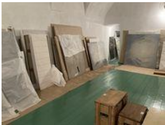
Nerozbalené obrazy [REDACTED]