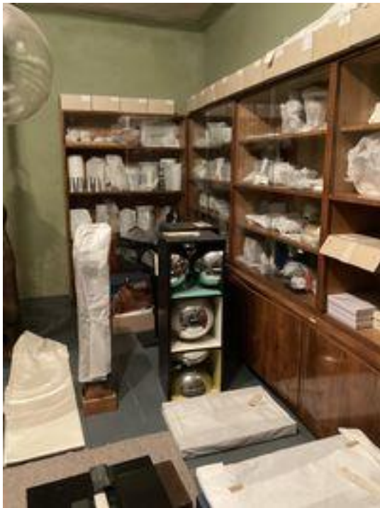
Drobná plastika [REDACTED]